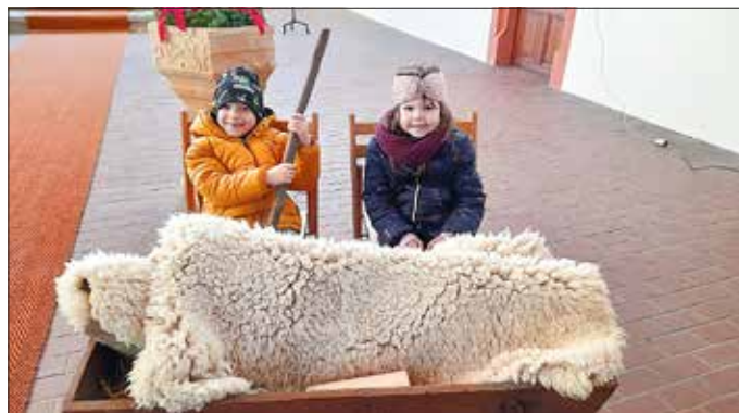
Krippenspiel unseres Kindergartens „Apfelbäumchen“ Rötha