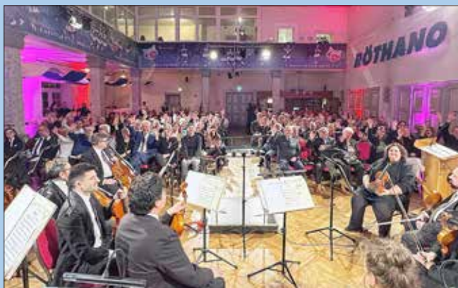
Neujahrsempfang der Stadt unter dem Motto „Rötha von A-Z“