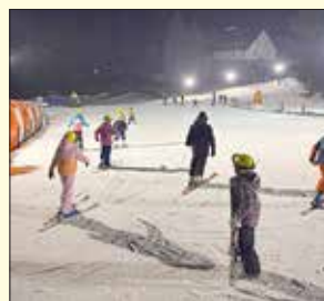
Abendliche Nacht-Skifahrt unter Flutlicht

Bereits zum vierten Mal hieß es für die Kinder der Grundschule Rötha: „Ab in den Schnee!“ Vom 19. bis 23. Januar 2026 tauschten 24 Schülerinnen und Schüler das Klassenzimmer gegen die Pisten des Fichtelbergs und erlebten eine Woche voller sportlicher Erfolge.