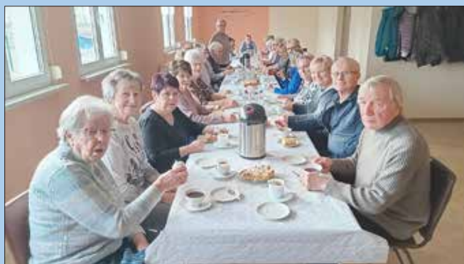
Seniorentreff in Espenhain

Nummehr haben auch die Seniorinnen und Senioren im Ortsteil Espenhain wieder eine langjährige und liebevoll gewonnene Tradition aufleben lassen: Sie trafen sich mit 27 Personen und treffen sich von nun an regelmäßig im Sportcasino in Espenhain. Melden Sie sich gern auch bei uns – wir vermitteln hier natürlich gern.